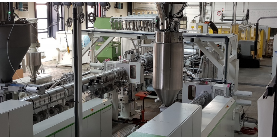
View into new lab line PR_201907_View_new lab_line.jpg